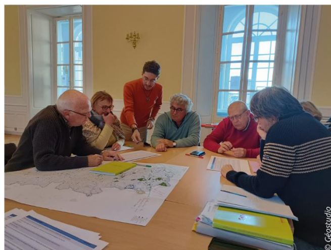
Atelier Diagnostic «Environnement» - 17 novembre 2022

Durant le dernier trimestre 2022, plusieurs temps d'échanges avec les élus ont été organisés. Ces ateliers avaient pour objectif de définir ensemble les enjeux du territoire notamment en matière de logements, de mobilité, d'activités économiques, d'environnement (préservation et valorisation de la biodiversité, la prise en compte des risques). Les élus ont partagé leurs connaissances du territoire permettant d'alimenter les diagnostics.