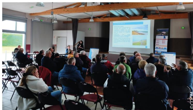
Réunion publique - Créances - 12 avril 2023

Ces temps d'échanges sont essentiels à la procédure, ils permettent d'alimenter les productions et d'assurer une cohérence des documents avec le cadre législatif et avec l'ensemble des plans et programmes.