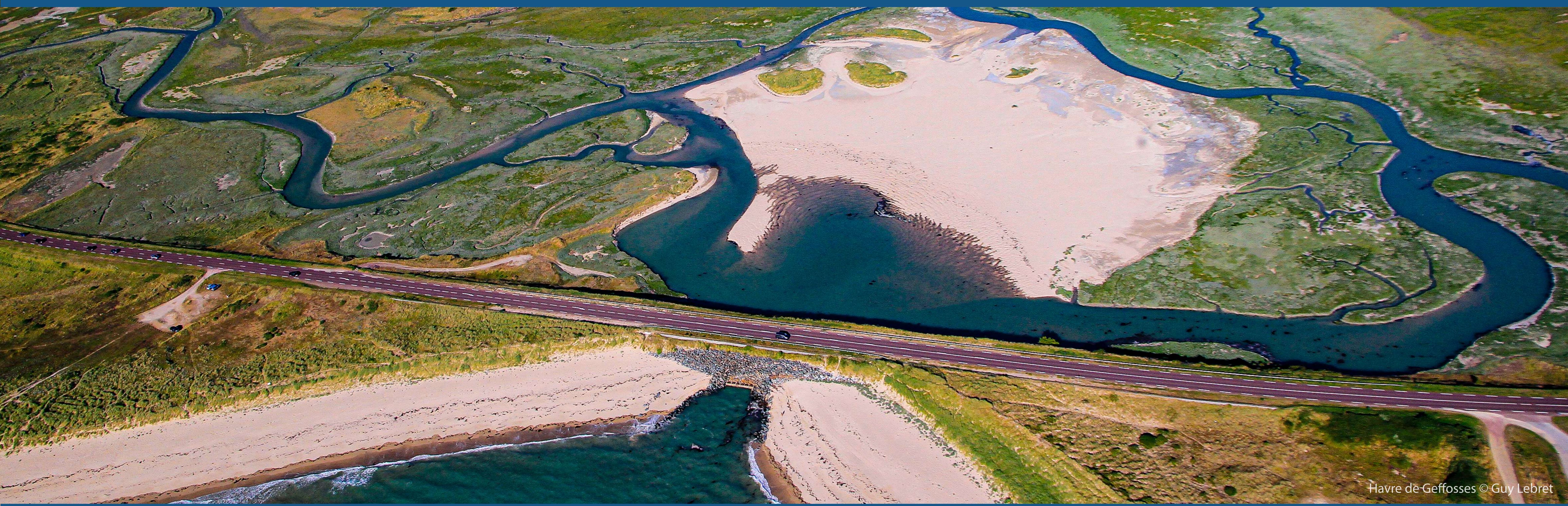
Havre de Géffosses